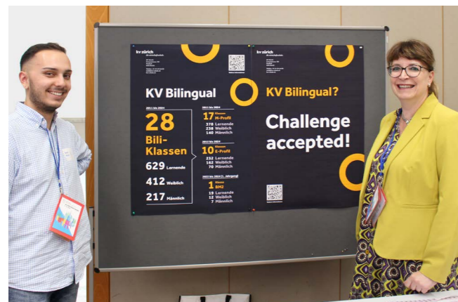
Eine Erfolgsgeschichte: «Bili» an der Wirtschaftsschule KV Zürich.

Der bilinguale Unterricht («bili») vermittelt Lernenden berufsrelevante Kompetenzen auf Deutsch und Englisch. Seit 25 Jahren gibt es im Kanton Zürich «bili» an vielen Berufsfachschulen und Berufsmaturitätsschulen.